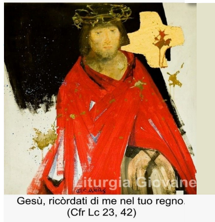
Gesù, ricordati di me nel tuo regno. (Cfr Lc 23, 42)

Sul retro precisiamo il tema di quest'anno.